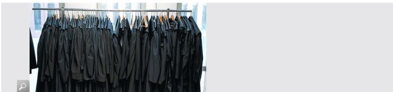
Togas de abogado colgadas en un perchero, en la Ciutat de la Justícia.

Arquitectos, abogados, farmacéuticos... Profesionales de distintos ámbitos han lanzado la voz de alarma a raíz de la reforma que prepara el Ministerio de Economía y que persigue modificar las reservas de actividad --lo que pueden y no pueden hacer legalmente unos y otros-- y aumentar la competencia .